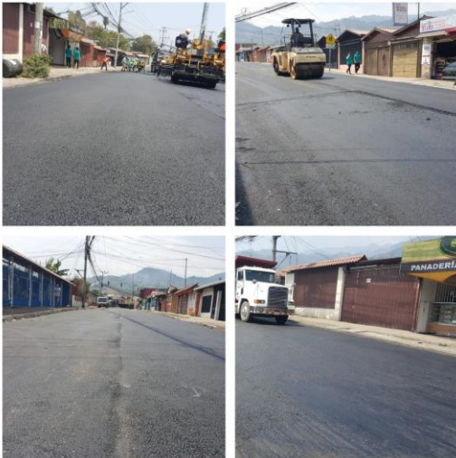
Sector Escuela San Felipe, en el distrito de San Felipe