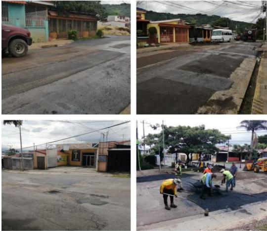
Sector del "Acapulco- CCA"