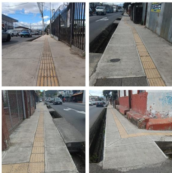
De Casa de la Cultura hasta Licorera Fercxo (Antiguo AyA), en el distrito de Alajuelita