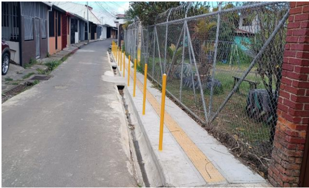
Parque de Urbanización Boca del Monte, en el distrito de Concepción