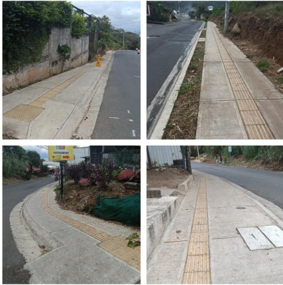
Carretera a Filtros, en el distrito de San Josecito