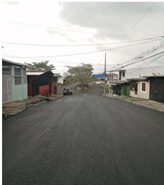
Urbanización La Guápil, en el distrito de San Felipe