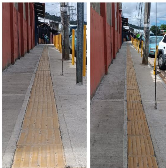
Entrada a la clínica, en el distrito de Alajuelita