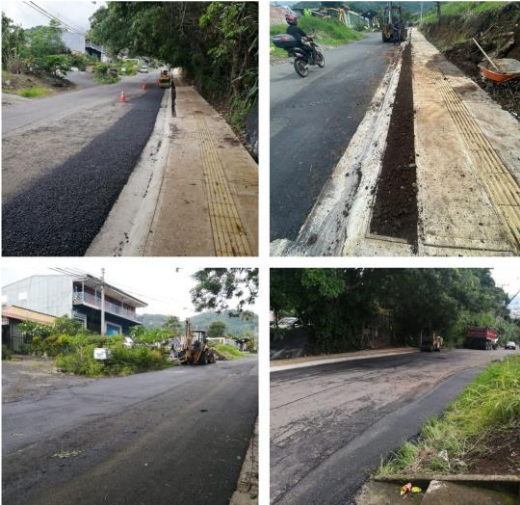
Carretera a Los Filtros, en el distrito de San Josecito