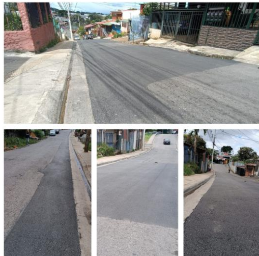
Entrada a “La Verbena”

Cabe destacar que se realizó el “Cierre de cordón de caño” en sectores donde se construyeron aceras y otros que estaban pendientes de proyectos anteriores. Algunos de los sectores intervenidos son: