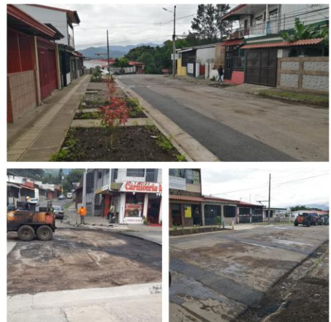
Sector del “Acapulco- Bosques de Paz”, en el distrito de Alajuelita