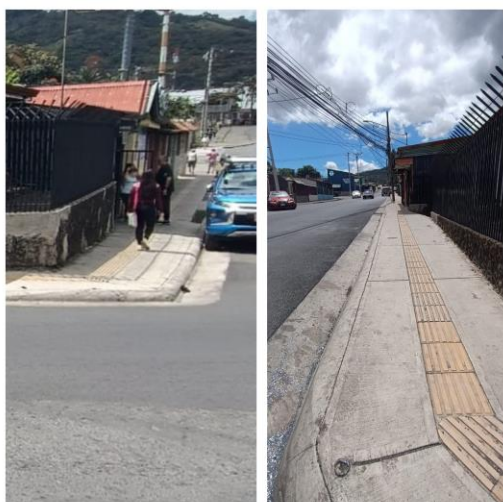
Sector de Maxi Pali- Iglesia Bautista