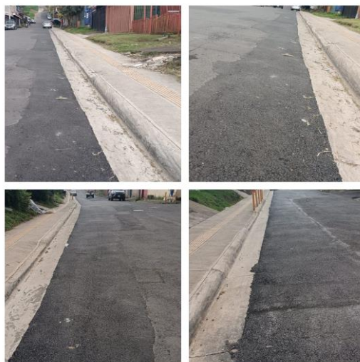
Sector de Vista San José