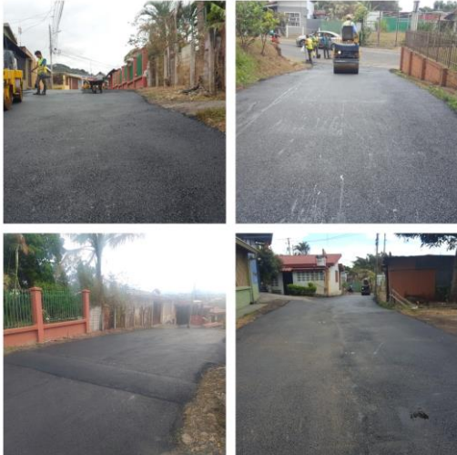
Urbanización Bella Vista, en el distrito de Alajuelita