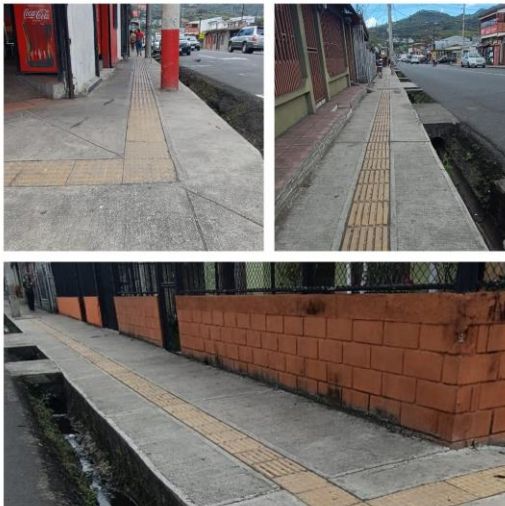
Esquina suroeste de Iglesia Católica hasta Megasuper, en el distrito de Alajuelita