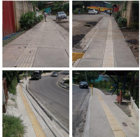
Sector del “Higuerón” hacia el sur, en el distrito de San Antonio