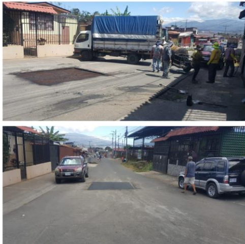
Sector de la Clínica, en el distrito de Alajuelita