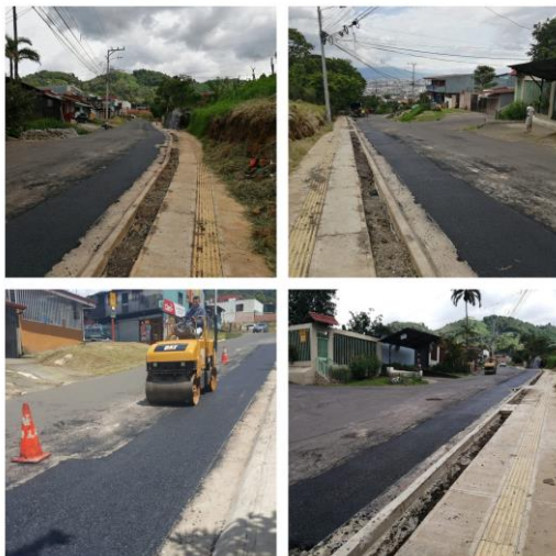
Carretera a Filtros