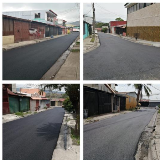
Urbanización Bellotas, en el distrito de San Felipe