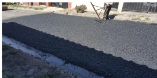
Urbanización Boulevard de la Guardia, en el distrito de San Felipe