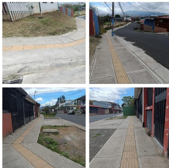
Sector del Super Acapulco hasta Cruz Roja, en el distrito de Alajuelita