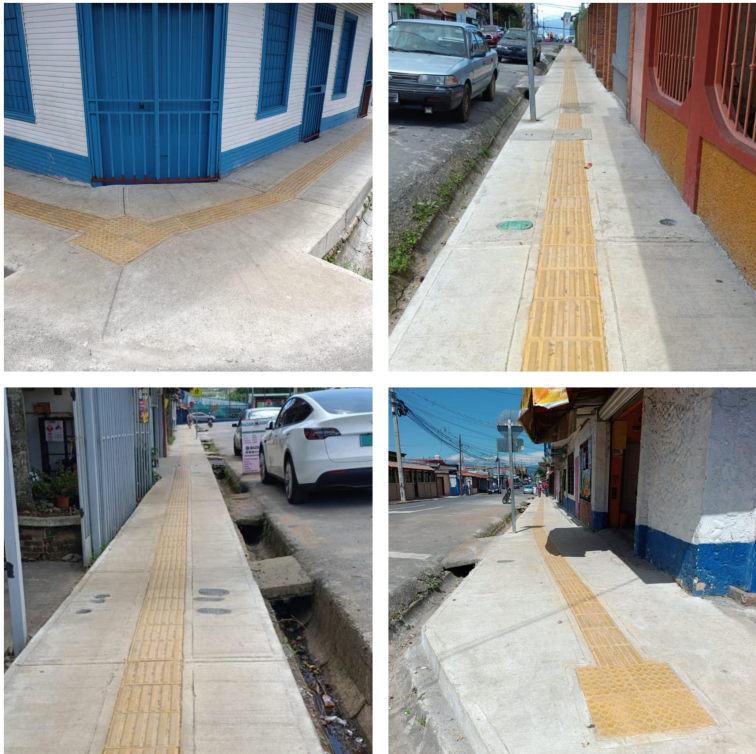
Esquina Suroeste del parque- escuela Abraham Lincoln