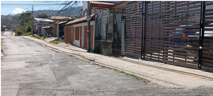
Calle El Alto